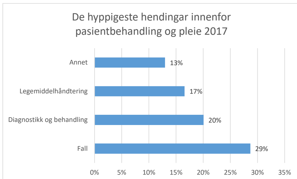
Figur 3: De hyppigste hendinger innenfor behandling og pleie

«Legemiddelhåndtering», «diagnostikk og behandling» samt «fall» er de pasientrelaterte typar av hendingar der det vert registrert flest saker.