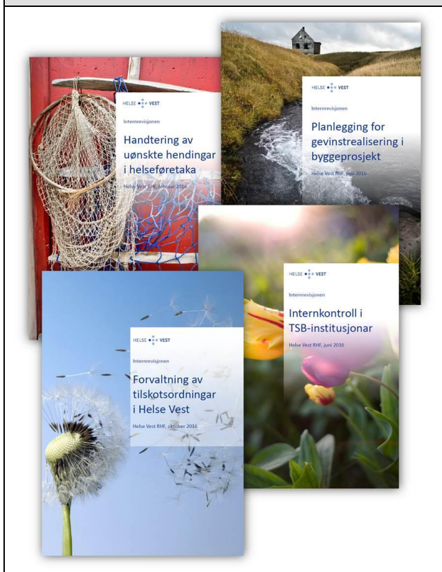
Figur 3 – Forsider til revisjonsrapportar i 2016

Eit godt gjennomført prosjekt, kor ein har hatt ein god dialog med revierte verksemdar og fagpersonar, aukar utsiktene for at tilrådde tiltak blir gjennomførte. På same måten verker handlingsplanane til dei administrerande direktørane i føretaka. Det å forplikte seg til endring, og erkjenne grunnlaget for ho, legg eit godt grunnlag for at det faktisk skjer noko.