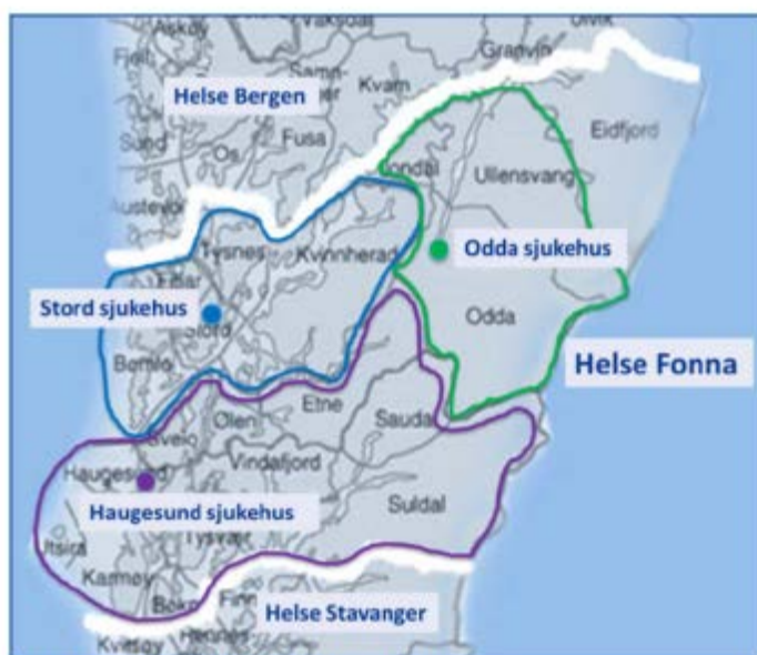
Figur 4. Sjukehusområdet i Helse Fonna

Prosjektrapporten omtalar ulike karakteristika ved sjukehuset. Stord sjukehus er eit akuttsjukehus som skal gje eit tilbod til dei store pasientgruppene i området. Det er medisinske og kirurgisk sengepostar og poliklinikkar ved sjukehuset i tillegg til operasjonsavdeling med fire operasjonsstover. Sjukehuset dekkjer ein befolkning på 49 000 som er forventa å stige til 56000 i 2030, og då særleg innan gruppa eldre. Kommunane i Sunnhordland har i dag fleire akutttinnleggingar enn vanleg gjennomsnitt pr. 1000 innbyggjarar.